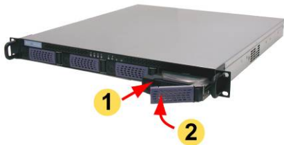
Einbau der Platteneinschübe