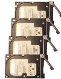
Festplatten eingebaut in die Einschübe

Bauen Sie die Platten in die Einschübe ein und sichern diese mit Schrauben